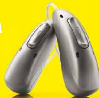
Phonak Audéo™ R Infinio