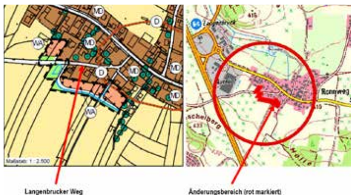
Änderungsbereich 13. FNP-Änderung

Im Rahmen der 13. Änderung sollen künftig u. a. ein „Allgemeines Wohngebiet“ mit einer öffentlichen Grünfläche dargestellt werden, als vorbereitende Bauleitplanung für den (künftigen) Bebauungsplan Nr. 43 „Ronnweg-Südwest“.